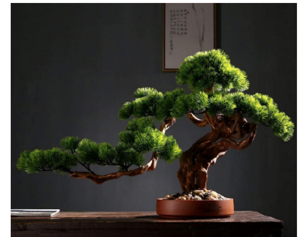
BONSAI BAUM ALS ELEMENT DER BESINNUNG MEDITATION